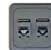
RJ45 CAT 3 (AMP)