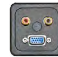
VGA + AUDIO-CINCH