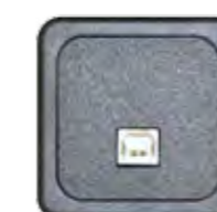
USB TYP B V 2.0