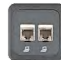
RJ45 CAT 6 GESCHIRMT (NEXANS)