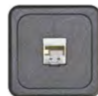
RJ45 CAT 6 GESCHIRMT (NEXANS)