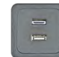
HDMI + USB