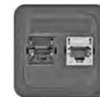
RJ45 CAT 6 (SYSTIMAX)