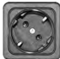
STECKDOSE 16A (DE, AT, NL)