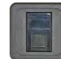
RJ45 CAT 5 MIT STAUBSCHUTZ (NEXANS)