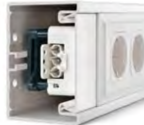
DIE NETBOX M MIT DAZUGEHÖRIGEN RAHMEN IST EINE UNKOMPLIZIERTE UND FLEXIBLE KABELKANALLÖSUNG.