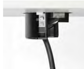
UNSERE BEWÄHRTE RASTMECHANIK GARANTIERE EINE KURZE MONTAGEZEIT.