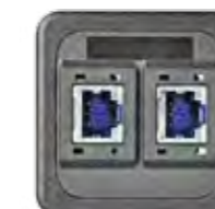
RJ45 CAT 6 GESCHIRMT (R&M)