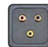
3X CINCH (AV)