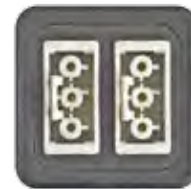
BUCHSENTEIL GST18 3-POL 16A