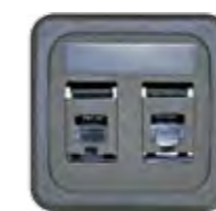
RJ12 CAT 3 (AMP)