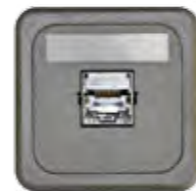
RJ45 CAT 6 (SYSTIMAX)