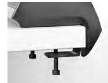
MIT HILFE DER KLEMMBEFESTIGUNG ODER DES MONTAGESETS POWERSTRIP LÄSST SICH DIE NETBOX FIN EINFACH UND FLEXIBEL AN DER TISCHKANTE BEFESTIGEN.