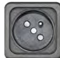
STECKDOSE 16A (BE, FR)