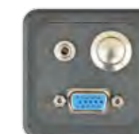
VGA + AUDIO + TASTER