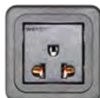
STECKDOSE 15A (THA)