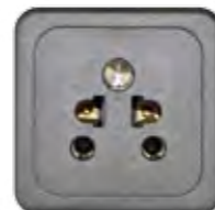
STECKDOSE 5A (IND)