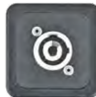
BUCHSENTEIL POWERCON 3-POL. 20A