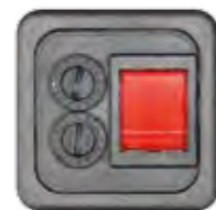
SCHALTER 2-POL., MIT ZWEI SICHERUNGEN