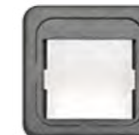
ADAPTER F. RJ45 (PANDUIT)