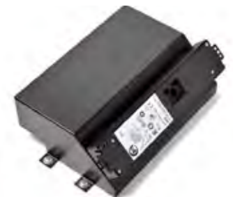
DIE NETBOX M4 WIRD AN DER RÜCKSEITE DER KABELBOX BEFESTIGT UND IST FÜR IHRE ANWENDUNG INDIVIDUELL KONFIGURIERBAR.