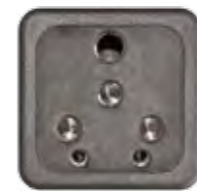
STECKDOSE 6/16A (IND)