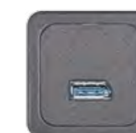
GC - DISPLAYPORT