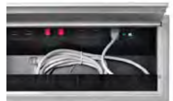
DIE KABELBOX BIETET AUSREICHEND STAURAUUM FÜR KABEL, NETZTEILE ODER FERNBEDIENUNGEN.