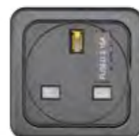
STECKDOSE 3,15A (GB)