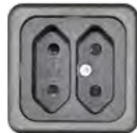
STECKDOSE 2,5A (EURO)