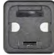
KOM.-TUNNEL MIT FRÄSUNGEN