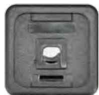
KOM.-TUNNEL MIT ZUGENTLASTUNG