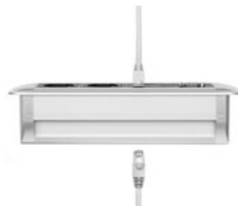
EINE INTEGRIERTE DURCHGANGSKUPPLUNG, SOGENANNTER GENDER CHANGER, ERMÖGLICHT IHNEN DIE EINFACHE INSTALLATION DER NETBOX LINE IM VORHANDENEN KABELMANAGEMENT.