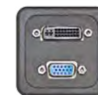
DVI-I + VGA