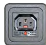
STECKDOSE 10A (TYP C13 M. VERRIEGELUNG)