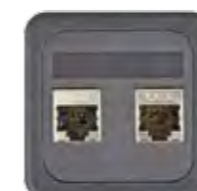
GC - RJ45 CAT 6 GESCHIRMT