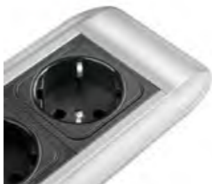
DAS ZEITGEMÄSSE UND FORMSCHÖNE ALUMINIUMPROFIL FÜGT SICH ELEGANT IN UNTERSCHIEDLICHE MÖBELKONZEPTE EIN.