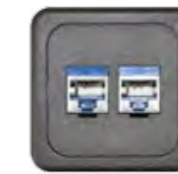
RJ45 CAT 6A GESCHIRMT (NEXANS)