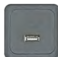
USB TYP A V 2.0