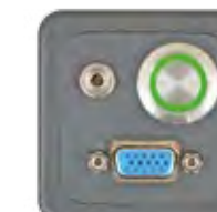
VGA + AUDIO + TASTER