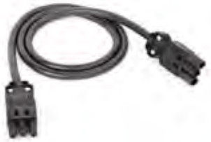
ENTSPRECHEND IHRER ANFORDERUNG, BIETEN WIR IHNEN VERBINDUNGSKABEL IN UNTERSCHIEDLICHEN LÄNGEN.