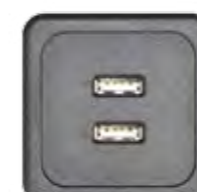
USB TYP A V 2.0