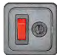
SCHALTER 1-POL., MIT SICHERUNG