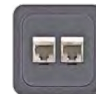
RJ45 CAT 6 GESCHIRMT (NEXANS)