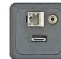
HDMI + AUDIO + RJ45