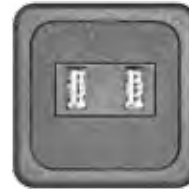
USB - LADEGERÄT