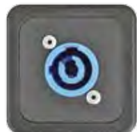
STECKERTEIL POWERCON 3-POL. 20A