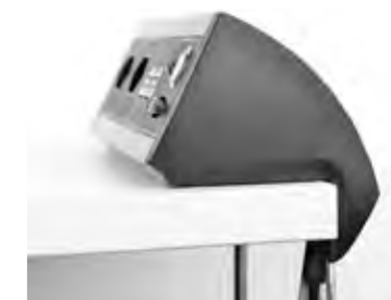
DIE NETBOX FIN IST AUFGRUND IHRES MODERNEN DESIGNS UND IHRER INNOVATIVEN KABELFÜHRUNG BESONDERS BEI FREISTEHENDEN TISCHEN GEEIGNET.

ANWENDUNGSBEREICHE: Freistehende Arbeitsplätze Konferenztische Home Offices