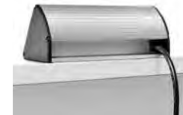
DAS BEWÄHRTE ALUMINIUMPROFIL VERLEIHT DER NETBOX GLOBAL EIN ZEITLOSES DESIGN.