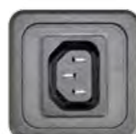
STECKDOSE 10A (TYP C13)