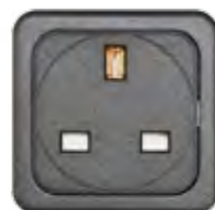
STECKDOSE 13A (IE, MY)