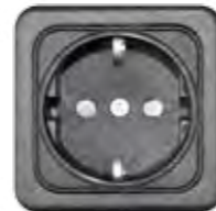
STECKDOSE 16A (DE, AT, NL)