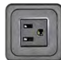
STECKDOSE 15A (US, JP, PH)