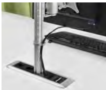
DIE NETBOX LINE BIETET IHNEN DIE MÖGLICHKEIT EINEN TRAGARM FÜR FLACHBILDSCHIRME ZU INTEGRIEREN.