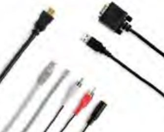
UNSERE DATEN- UND AUDIO-/ VIDEOKABEL ENTSPRECHEN DEN NEUESTEN STANDARDS UND SIND IN VERSCHIEDENEN LÄNGEN ERHÄLTICH.