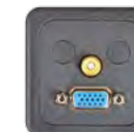
VGA + VIDEO-CINCH