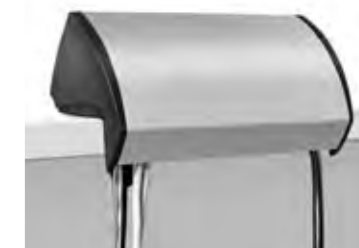
DIE STROM- UND MEDIENKABEL WERDEN DURCH DIE INTEGRIERTE KABELFÜHRUNG OPTIMAL GESCHÜTZT.