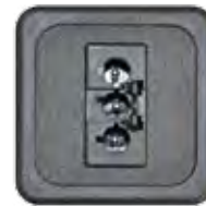
STECKERTEIL GST18 3-POL. 16A