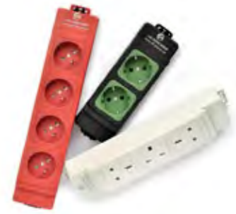
DIE NETBOX M IST WAHLWEISE MIT ZWEI, DREI ODER VIER MODULEN UND IN UNTERSCHIEDLICHEN FARBVARIANTEN ERHÄLTlich.

ANWENDUNGSBEREICHE: Büroarbeitsplätze Kabelkanäle Trennwandsysteme Paneele Doppelböden