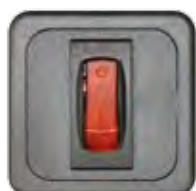
SCHALTER 2-POL., MIT ÜBERSTROMSICHERUNG