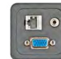
VGA + AUDIO + RJ45