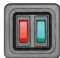
SCHALTER 1-POL. VERSENKT