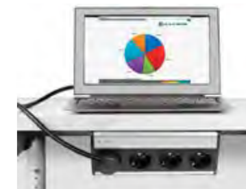
NEBEN DER KLASSISCHEN ANWENDUNG AUF DEM SCHREIBTISCH, IST EBENFALLS EINE INSTALLATION DER NETBOX GLOBAL UNTERHALB DER TISCHPLATTE MÖGLICH.

ANWENDUNGSBEREICHE: Büroarbeitsplätze Home Offices Schul- und Universitätsmöbel