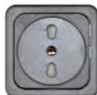
STECKDOSE 16A (IT)