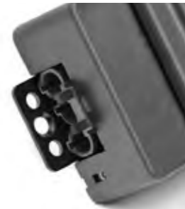
SEITLICHE FIXIERUNGSLASCHEN GEWÄHRLEISTEN EINE EINFACHE UND SICHERE BEFESTIGUNG DER NETBOX M.