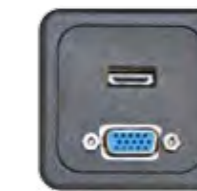
HDMI + VGA