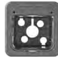
KOM.-TUNNEL TYP 2