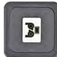
BUCHSENTEIL ST17 2-POL. 16A