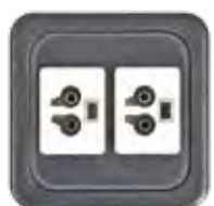
BUCHSENTEIL ST17 2-POL. 16A