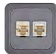
GG45 CAT 7 GESCHIRMT (NEXANS)