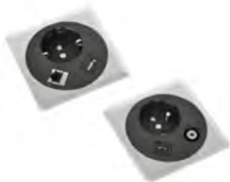
EINE AUSWAHL VERSCHIEDENER STECKDOSEN UND KOMMUNIKATIONSMODULE LÄSST INHNEN ALLE FREIHEITEN BEI DER KONFIGURATION DER NETBOX POINT.