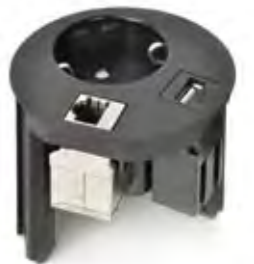
NETBOX POINT: PLATZSPARENDE LÖSUNG MIT EINER STECKDOSE UND ZWEI AUSTAUSCHBAREN KOMMUNIKATIONSMODULEN.