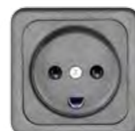
STECKDOSE 10A (DK)