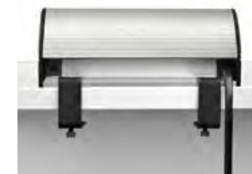
NEBEN DER DARGESTELLTEN KLEMMBEFESTIGUNG, LÄSST SICH DIE NETBOX GLOBAL MIT DEM MONTAGESET POWERSTRIP ODER EINER SCHRAUBBEFESTIGUNG FIXIEREN.