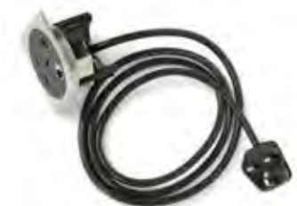
DIE NETBOX POINT WIRD STANDARDMÄSSIG MIT EINEM FEST ANGESCHLOSSENEN STROMKABEL GELIEFERT.