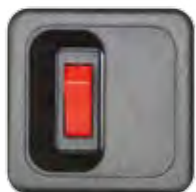
SCHALTER 1-POL. VERSENKT