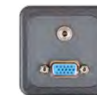
VGA + AUDIOKLINKE