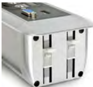
DURCH DIE RASTMECHANIK LÄSST SICH DIE NETBOX LINE EINFACH UND SCHNELL MONTIEREN.