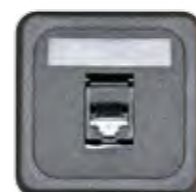
RJ45 CAT 3 (AMP)