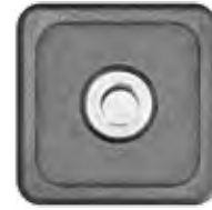
TFT - HALTERUNG