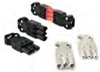
UNSERE STECKVERBINDER SIND IN UNTERSCHIEDLICHEN SPEZIFIKATIONEN UND FARBEN ERHÄLTICH.