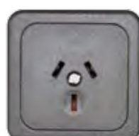
STECKDOSE 10A (AUS)