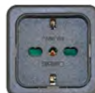
KOMBI-STECKDOSE 16A (IT)