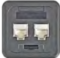
KOM.-TUNNEL GC - RJ45