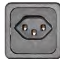
STECKDOSE 16A (CH)