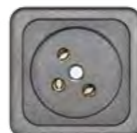
STECKDOSE 16A (IL)