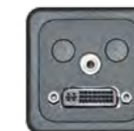
DVI-I + AUDIO