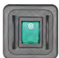
SCHALTER 2-POL. VERSENKT