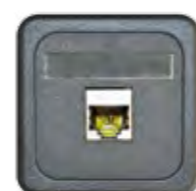
GC - RJ45 CAT 6 GESCHIRMT