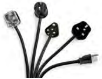
UNSERE NETZANFANGSKABEL SIND IN DEN STANDARDS VERSCHIEDENER LÄNDER LIEFERBAR.

Unsere Audio- und Videokabel übertragen Bild und Ton in bester Qualität.